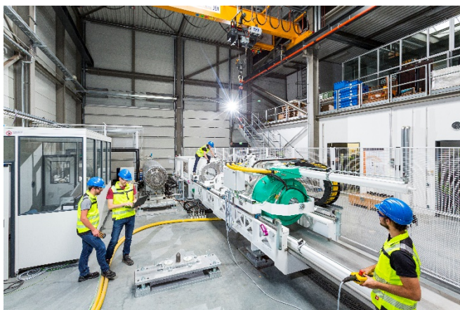
Abb. 1 Mitarbeiter des Bereichs Geotechnologien bereiten den Teststand für eine Versuchsreihe vor.

Für das Forscher-Team am Fraunhofer IEG sind die Arbeiten für den Testbetrieb aufwendig. Zunächst muss der Autoklav mit Gesteinsproben befüllt werden. Dann werden Druck und Temperatur schrittweise hochgefahren, die Bohrwerkzeuge eingestellt und die Fluide vorbereitet. In der Regel dauert es einen ganzen Tag, bis die Simulation startet. Doch der Aufwand lohnt sich, denn für die Bohrindustrie entstehen vielfältige Vorteile. Sind die spezifischen Bedingungen an einem Standort erst einmal in der Simulation ausgetestet, erhalten die Betreiber höhere Planungssicherheit. Der Bohrbetrieb wird effizienter, da alle Werkzeuge von vornherein optimal eingestellt sind. Die Betreiber können so letztlich Millionen Euro einsparen. Diese Optimierungsmaßnahmen bei der Geothermie tragen dazu bei, die Energiewende insgesamt noch ökonomischer und effizienter zu gestalten.